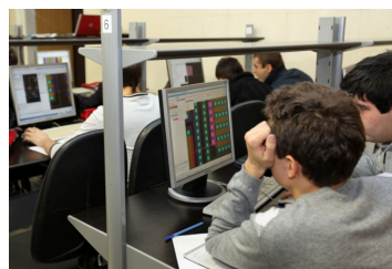
Лабораторный практикум по САПР СБИС 65 нм